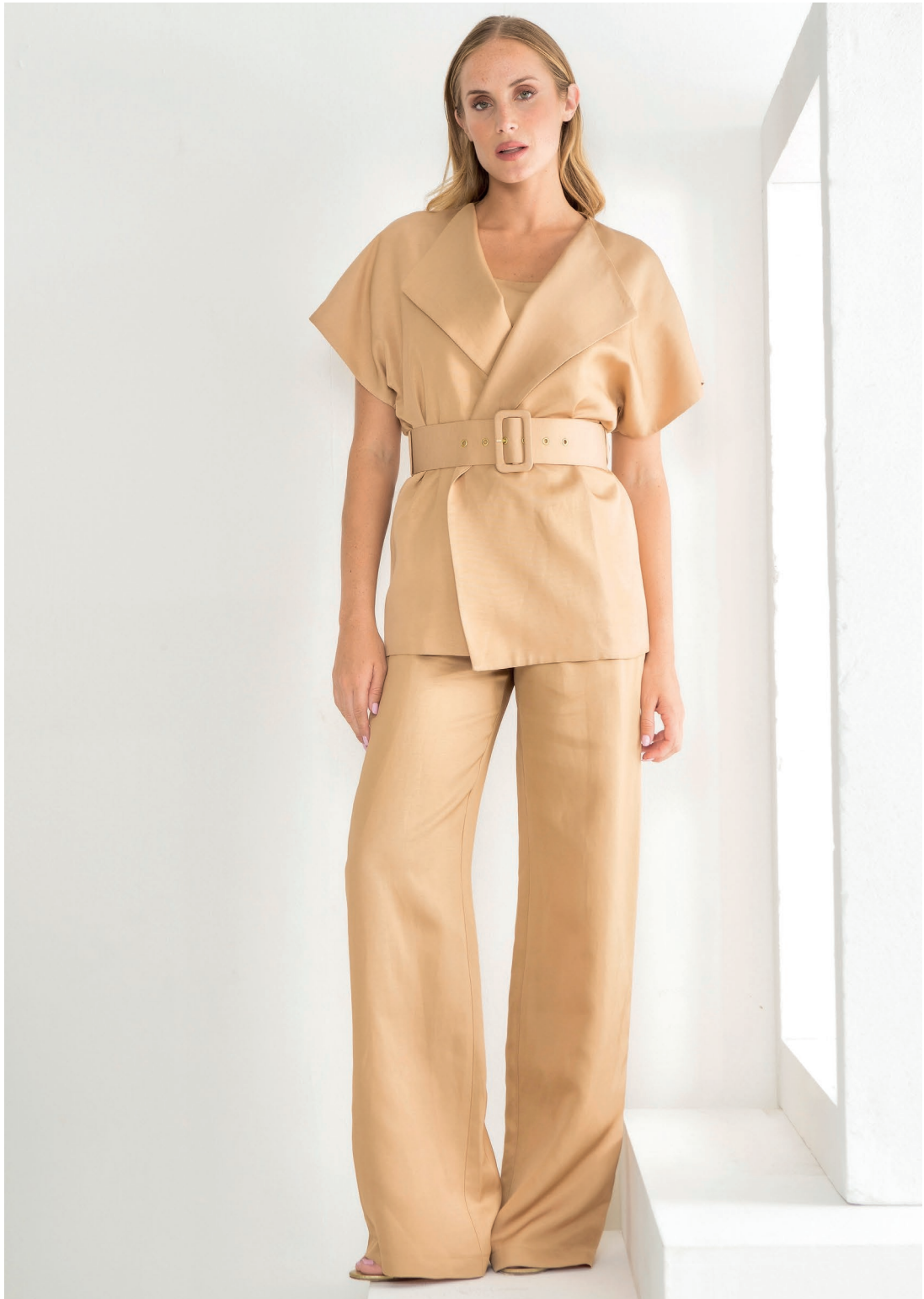
Giacca 426120 Pantalone 426121