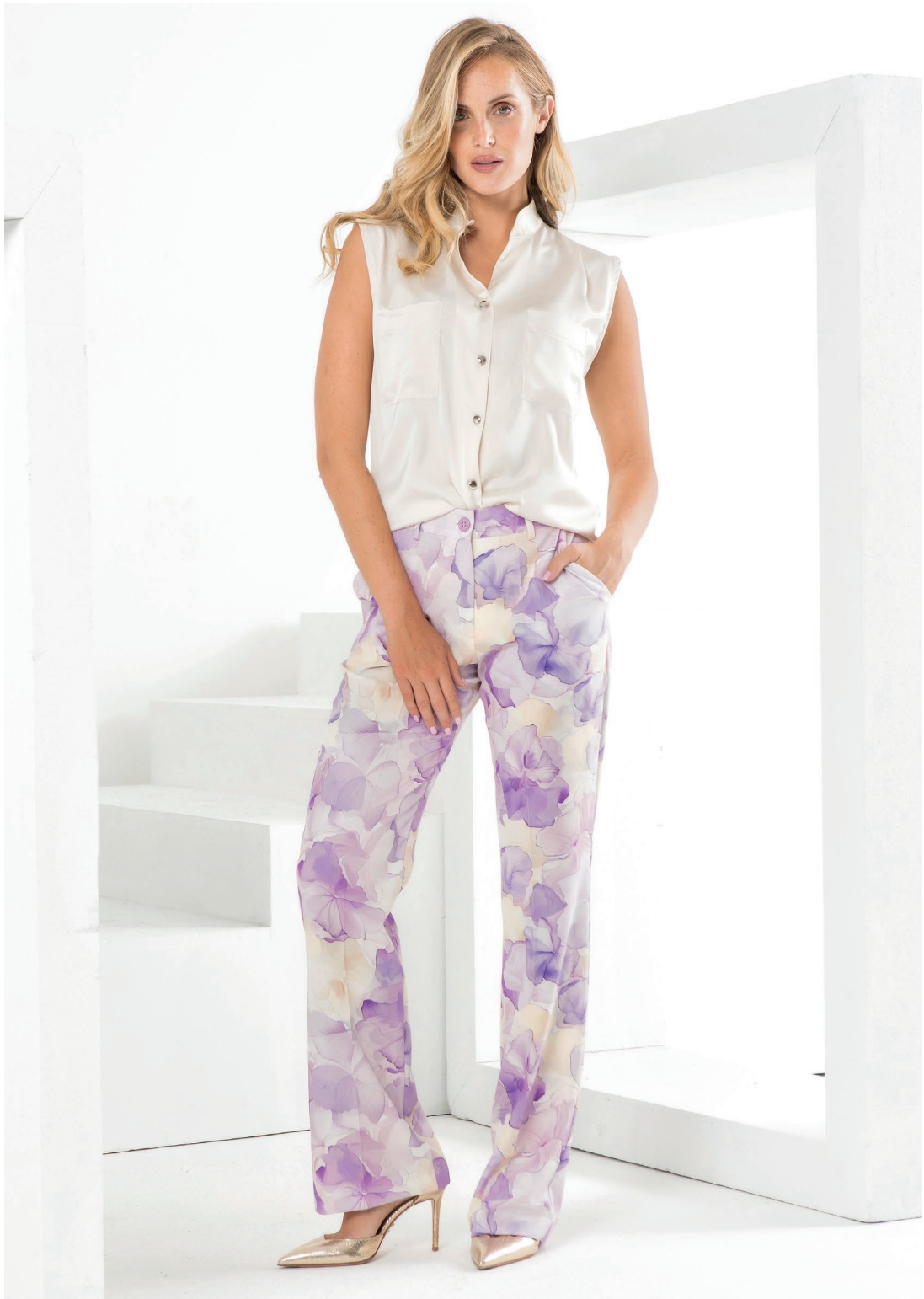
Camicia 426061 Pantalone 426042