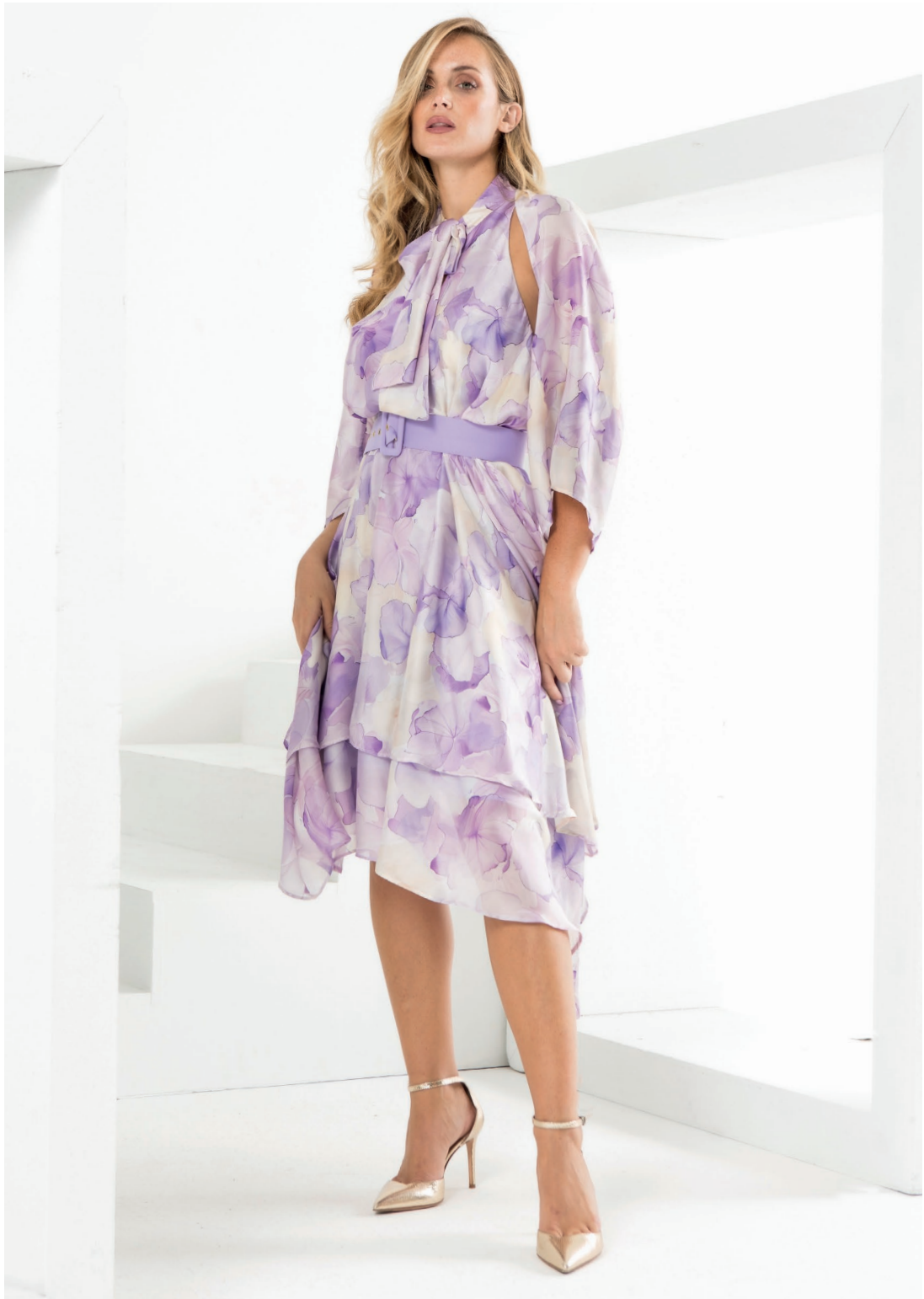
Abito 426052 Coprispalle 424040