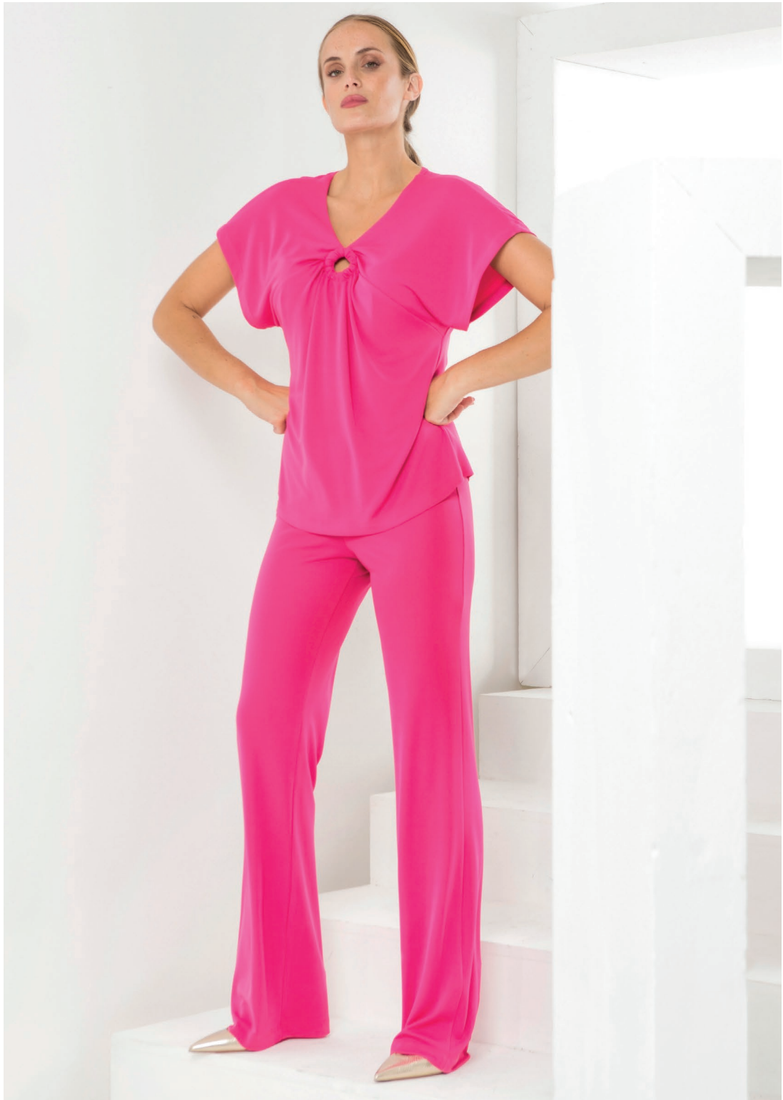
Maglia 426095 Pantalone 426085