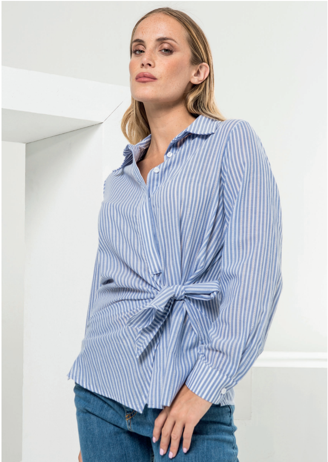
Camicia 426110 Jeans 525151