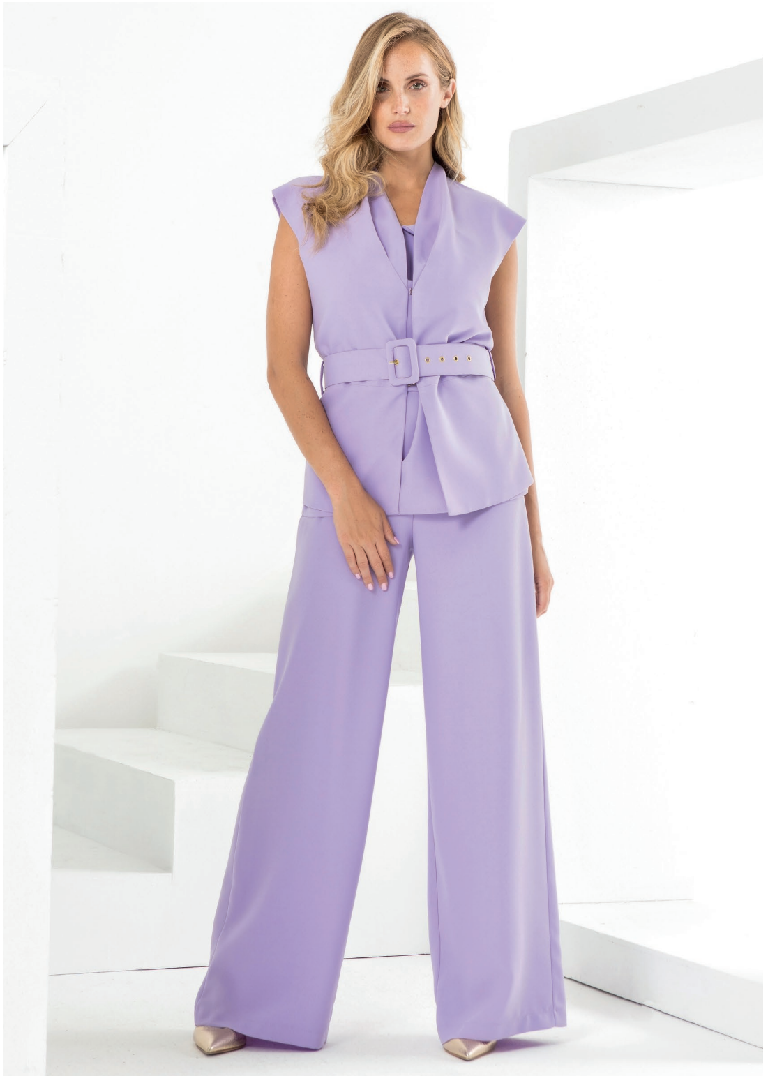
Giacca 426038 Pantalone 426037