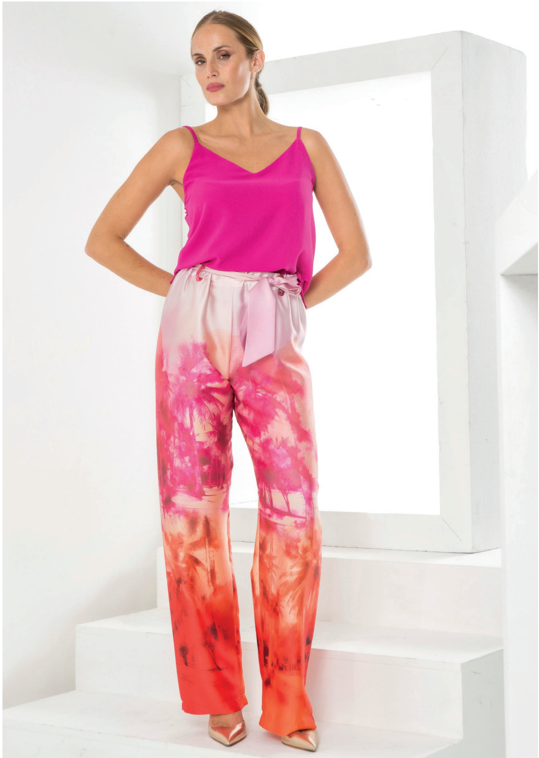
Top 426129 Pantalone 426093