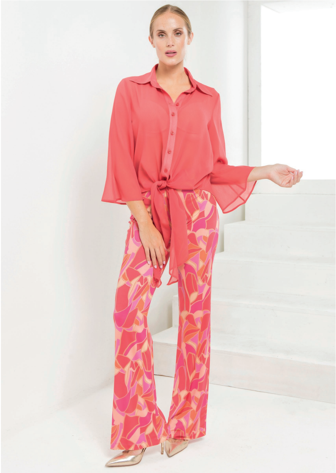
Maglia 426109 Pantalone 426091