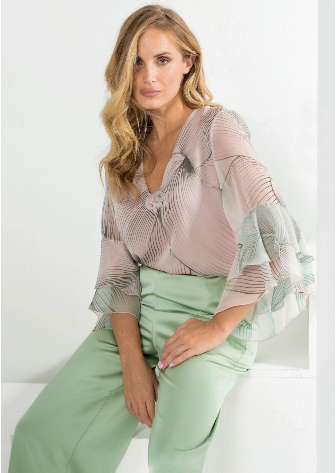
Blusa 426100 Pantalone 426054