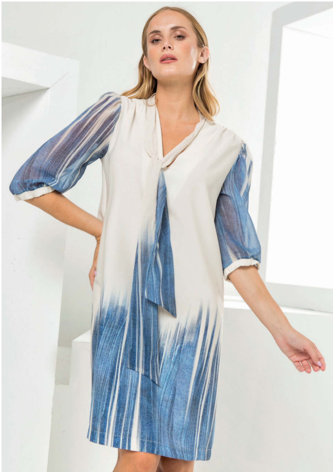
Maglia 426089 Gonna 426105