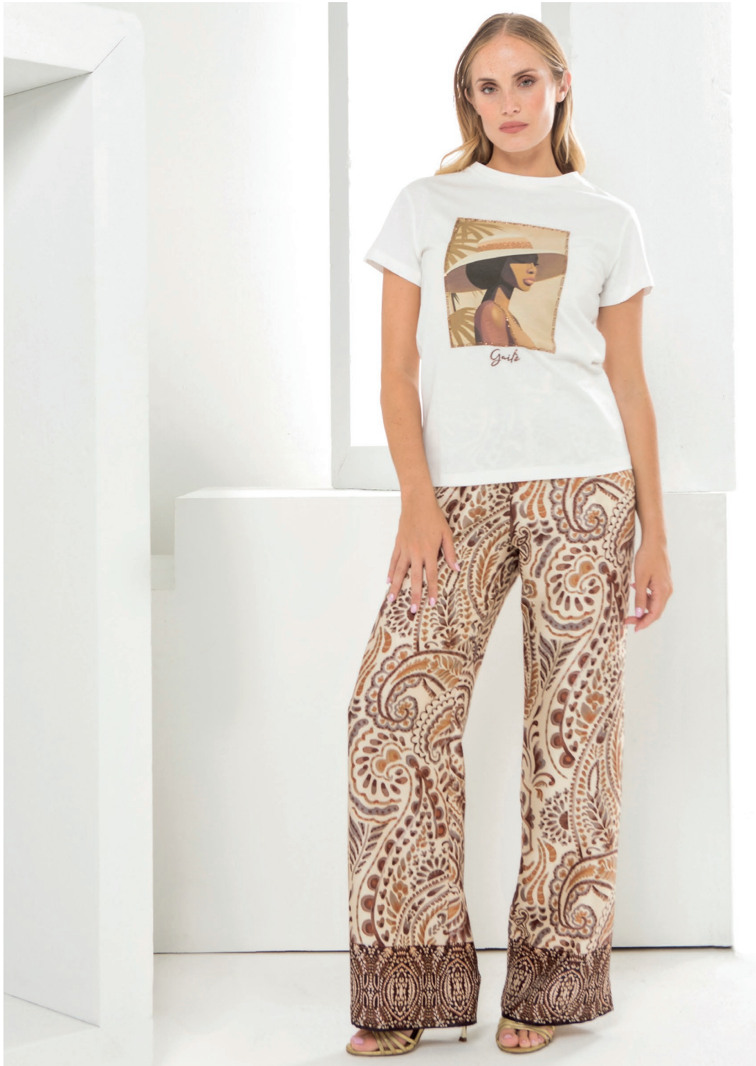
T-shirt 426005 Pantalone 426139