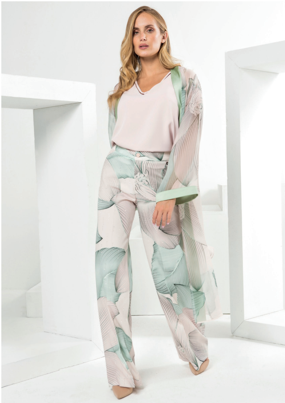
Canotta 426148 Pantalone 426108